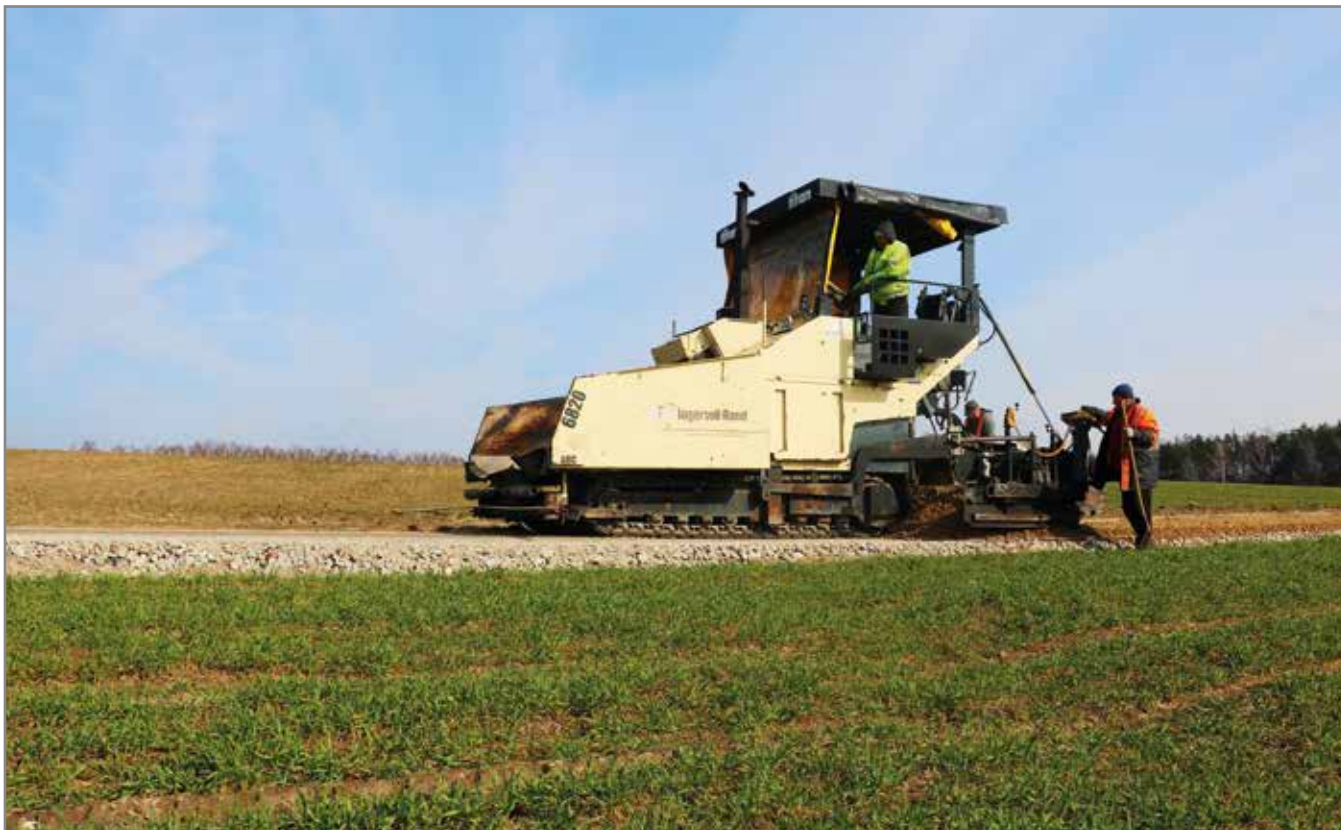
Przebudowa drogi w Pomocni