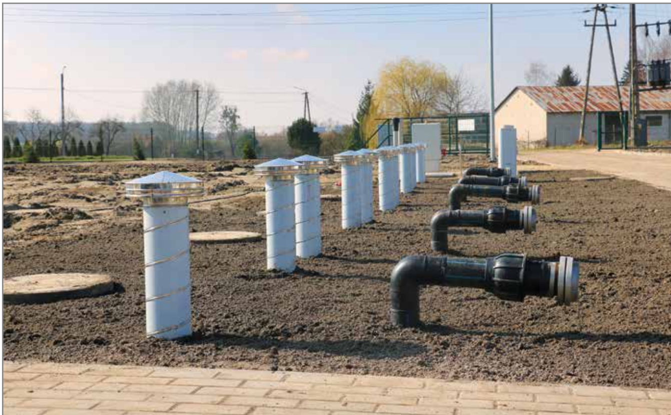
Przebudowa Stacji Uzdatniania Wody w Kosewie była jednym z kluczowych projektów ostatnich lat